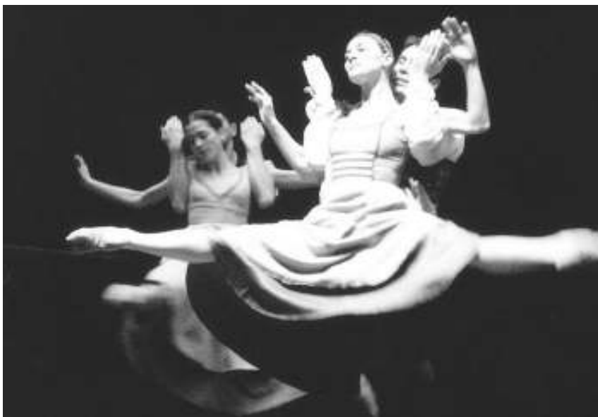
"Romeo y Julieta" ya se representó en el Auditori el 11 de febrero de 1999.

El coreógrafo compareció ayer en rueda de prensa para dejar claro que no se trataba de una versión: "No he cambiado ni un sólo movimiento; la escenografía es la misma y sólo cambian los intérpretes". Sin embargo, esta